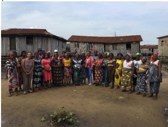
Lancement du processus de capitalisation au Bénin

De même, l'association participe à la formation de jeunes sur les énergies renouvelables qu'il sera possible de mettre à profit.