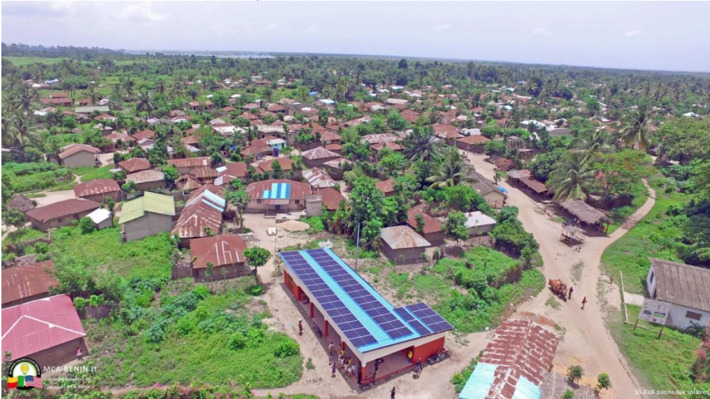
Un exemple de Café Lumière déjà réalisé au Bénin

Le résultat de ce DAC est attendu pour le 1 er trimestre 2024.