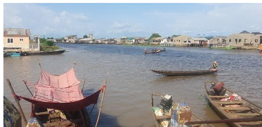
Commune de Sô-Ava

Au Bénin , la vie de la cité lacustre, où la loi de l'eau s'impose, s'articule autour de l'Autorité du Roi . Ce dernier, acteur incontournable des lieux, est le gardien d'un équilibre dans lequel toute intervention s'inscrit.