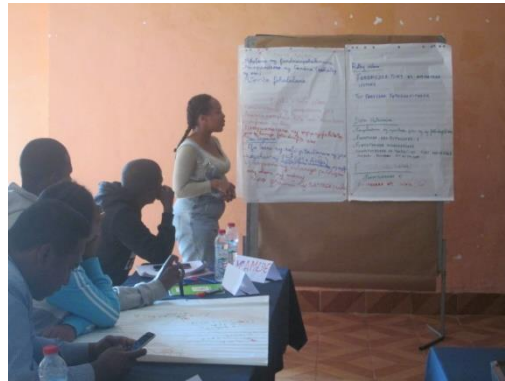
Restitution du travail de groupe Madagascar févr-23

Fort de l'expérience des six premiers Cafés Lumière mis en service, il est possible d'avoir aujourd'hui un premier retour d'expérience sur le fonctionnement des SCGM, garantes de la gouvernance des Cafés Lumière. Ces structures fonctionnent avec 3 commissions : le suivi de la gestion et la protection du patrimoine matériel et infrastructures, le suivi des entretiens des équipements et des matériels, et enfin, le suivi du paiement des taxes et redevances.